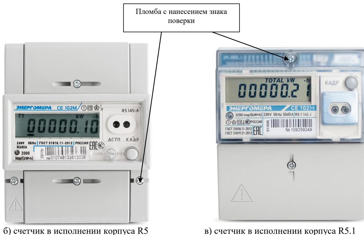
Рисунок 1 - Общий вид счетчиков с указанием места ограничения доступа к местам настройки (регулировки)